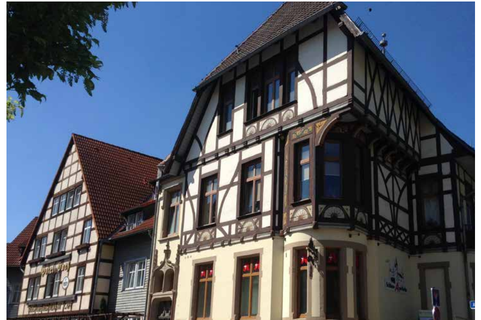
Die historische Altstadt von Wernigerode in unmittelbarer Nähe