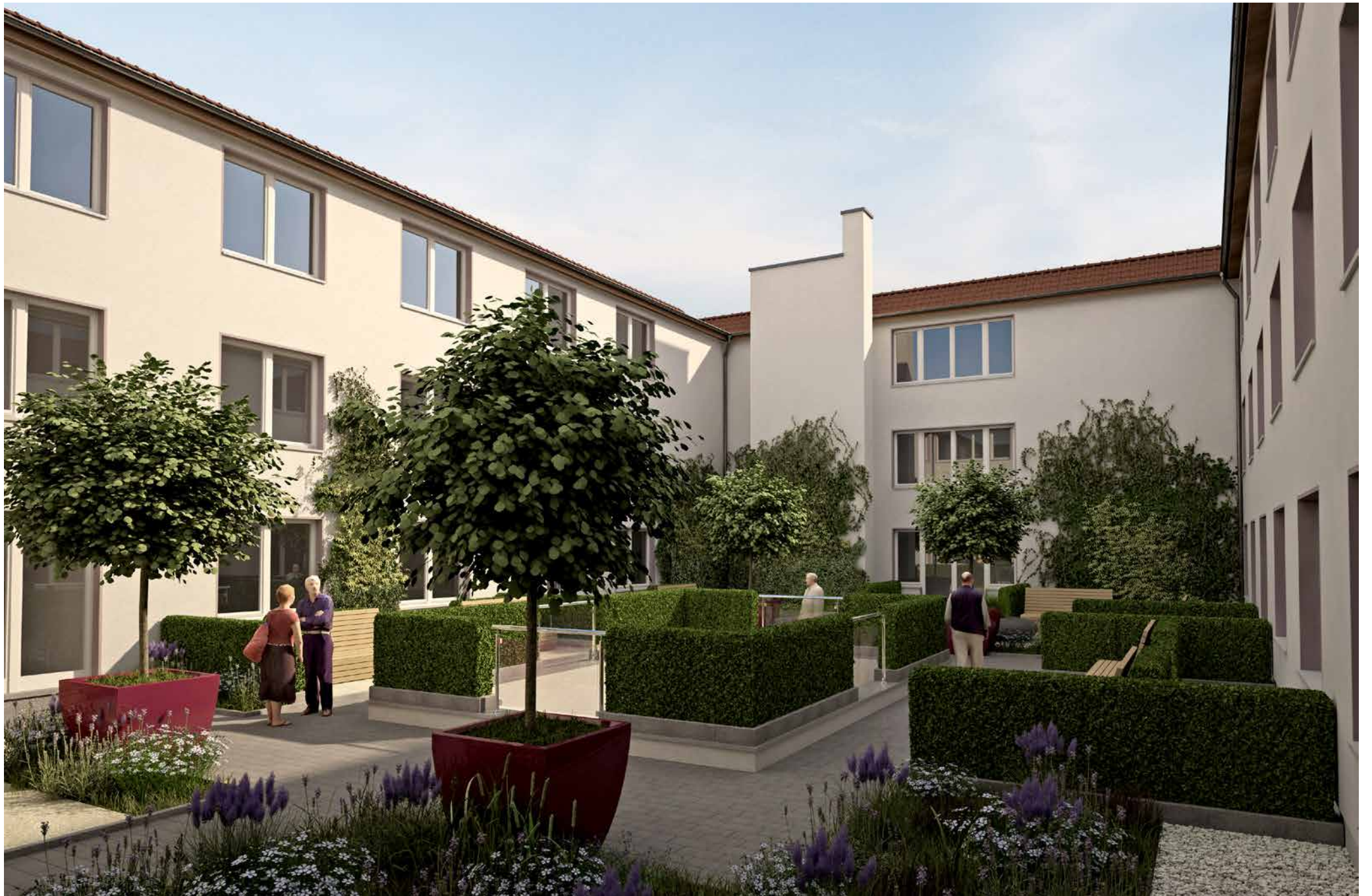
Der begrünte Innenhof