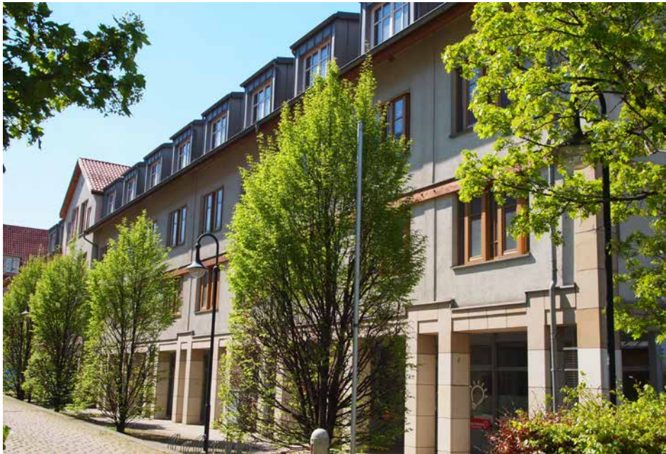
Blick von der Pfarrstraße auf das advita Haus Wernigerode