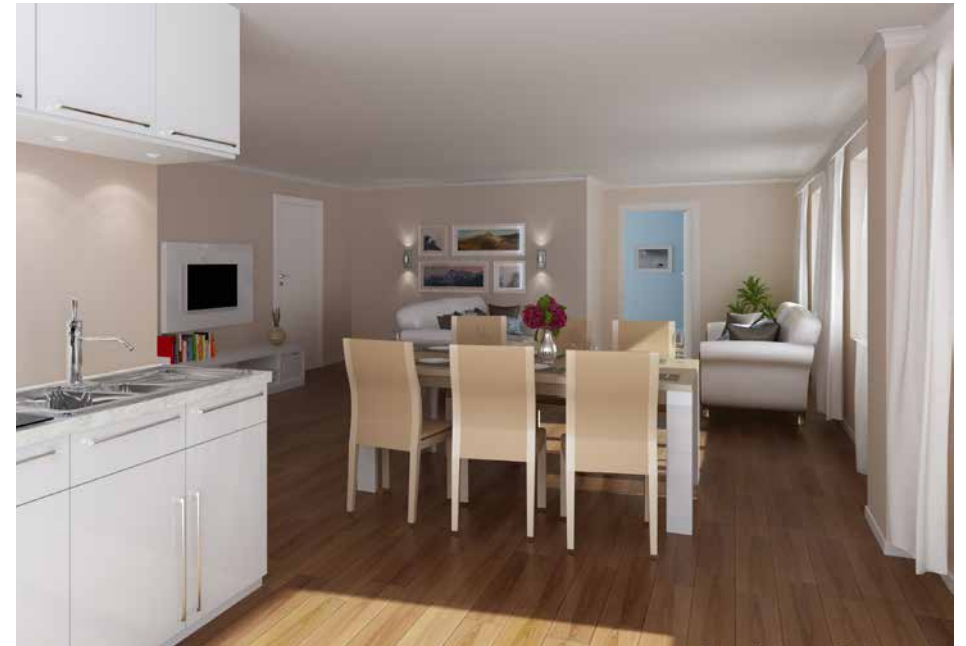
Beispielhafte Darstellung der 2-Raum-Wohnung