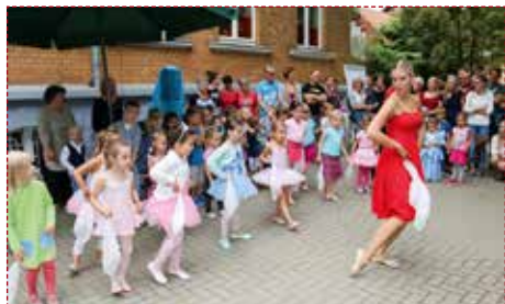
Die Ballettgruppe der Kita »Villa Sonnenschein« führt ihre neusten Tänze auf.

Die Kinder der Kita »Villa Sonnenschein« feierten am Freitag, den 16. September den 54. Kindergartengeburtstag. Mit Tanz, Gesang und viel Spaß feierten die 2 bis 6-jährigen Kinder mit ihren Erzieherinnen, Eltern und Großeltern ein ausgelassenes Fest.