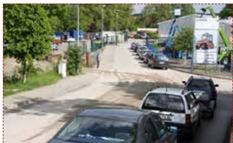
Diese Warteschlangen sollen der Vergangenheit angehören.

Nach dem nun erfolgreich abgeschlossenen Umbau ist das neue Gelände fast doppelt so groß,