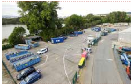
Das erweiterte Gelände des Wertstoffhofes Wernigerode aus der Vogelperspektive.

so dass die langen Warteschlangen vor dem Tor des Hofes während der Anliefererspitzenzeiten minimiert werden können. Gleichzeitig soll durch das neue Markierungssystem sowie die erhöhten Containerkapazitäten eine dienstleistungsgerechtere Benutzung des Wertstoffhofes gewährleistet werden.