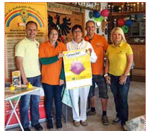
Mitarbeiter des Typisierungs-Teams des Vereins für krebskranke Kinder Harz e.V. sowie der Aktion Knochenmarkspende Sachsen-Anhalt e.V. der Uniklinik Magdeburg

Das Team um den Vereins-Chef hat nicht nur viele Erfahrungen bei den Aktionen gesammelt und mit mehreren Registern zusammengearbeitet, sie sind auch in ihrer eigenen Aufklärungsreihe an vielen Institutionen unterwegs, um mit Mythen aufzuräumen, Ängste zu nehmen und transparent die Schritte als zukünftigen Spender zu erklären. Dazu gibt es am 2. November 2016 von 16:00 bis 18:00 Uhr die Möglichkeit, sich vor Ort zu informieren. //