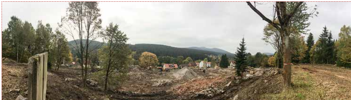
Die Abrissarbeiten auf dem Gelände des zukünftigen Resorts werden bald abgeschlossen sein.

der eingeschlagene Weg der Ortsentwicklung nun Früchte trägt. Langfristig werden sich die Investitionen für die gesamte Stadt auszahlen«, so Oberbürgermeister Peter Gaffert. //