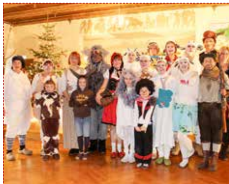
Sehr beliebt bei allen sind die Theateraufführungen der »Großen« für die »Kleinen«.

Fünf Vorstellungen werden am 6. Dezember für Kinder aus den Wernigeröder Kindertageseinrichtungen und Grundschulen gezeigt. Die letzte Vorstellung um 16:15 Uhr ist öffentlich. Dazu sind alle die Kinder mit ihren Eltern und Großeltern herzlich eingeladen, die vormittags nicht dabei sein konnten. Der Eintritt ist frei. //