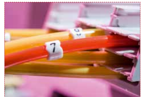
Glasfaserkabel sorgen in Zukunft für schnelles Internet in Wernigerode.

Im MFG wird das Lichtsignal von der Glasfaser in ein elektrisches Signal umgewandelt und von dort über das bestehende Kupferkabel zum Anschluss des Kunden übertragen. Um die Kupferleitung schnell zu machen, kommt Vectoring zum Einsatz. Diese Technik beseitigt elektromagnetische Störungen. Dadurch werden beim Hoch- und Herunterladen höhere Bandbreiten erreicht. Es gilt die Faustformel: Je näher der Kunde am MFG wohnt, desto höher ist seine Geschwindigkeit. //