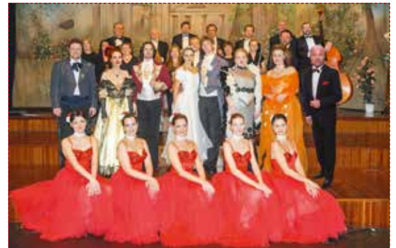
Die große Johann Strauß Gala