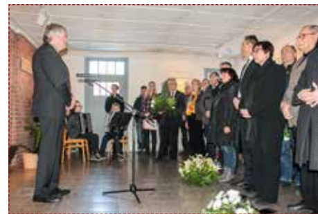
Mit Kränzen und Blumen gedachten viele Anwesende den Opfern des Nationalsozialismus.

Die Mahn- und Gedenkstätte in Wernigerode erinnert an das dunkelste Kapitel der neuen deutschen Geschichte. Während des Kriegsjahres 1941 entstand das Lager für Zwangsarbeiter aus Flandern und Nordfrankreich. Ab 1943 diente es als Außenlager des KZ Buchenwald. Bis zu 800 Häftlinge waren vor Ort untergebracht. //