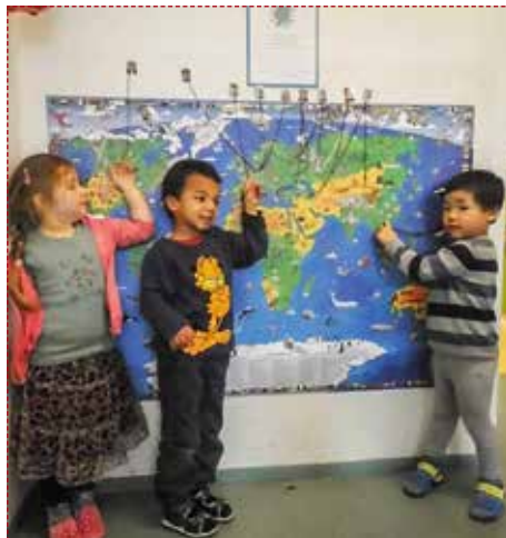
Auf einer Weltkarte zeigen die Kinder, wo ihre Familien und Freunde zu Hause sind.