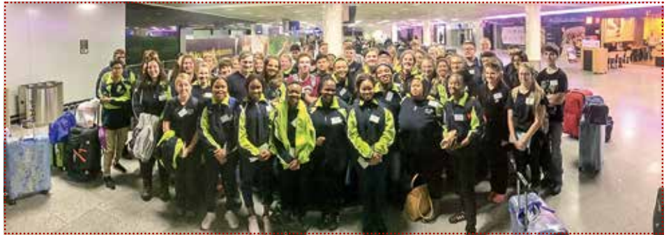
Ankunft südafrikanischer Schüler in Deutschland.

Der Freundeskreis Südafrika organisiert die Bahnfahrt zu den Gastfamilien sowie die Kranken-, Unfall- und Haftpflichtversicherung. Die Schüler bringen ihr eigenes Taschengeld mit. Die Gastfamilien bieten den Jugendlichen Unterkunft, Verpflegung und die Teilnahme am Familienalltag. Der Freundeskreis Südafrika ist eine unpolitische