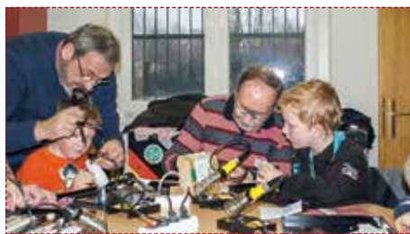
Auch der Bastelnachmittag mit dem Deutschen Amateur-Radio Club e.V. war ein voller Erfolg.

Die sehr filigrane Arbeit an den Morsegeräten verlangte den großen Kids sehr viel Genauigkeit und Geduld ab. Aber auch die Kleineren arbeiteten mit Begeisterung an ihren Lichtspielen. Besonders stolz waren die Kids natürlich, als sie ihre »Diplome« und »Jungfunkerausweise« überreicht bekamen. Auch nach der Veranstaltung waren alle Teilnehmer noch lange an ihren Geräten – die sich wirklich sehen lassen konnten – sichtlich vertieft beschäftigt. //