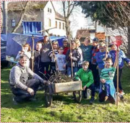
Die Kinder und Jugendlichen vom Jugendtreff Silstedt packen jedes Jahr beim Frühjahrsputz tatkräftig mit an.