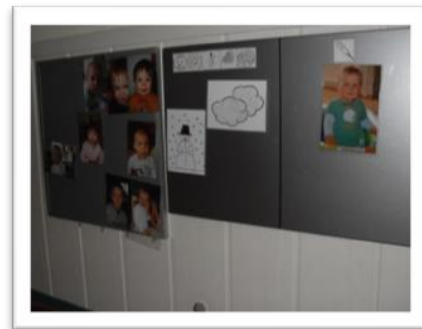
Wie ist das Wetter?