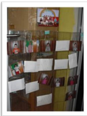
Wer ist schon da?