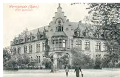
Das Fürstliche Gymnasium um das Jahr 1900

Die historischen Schulfotos können ab sofort an der Kasse des Harzmuseums (außer montags,