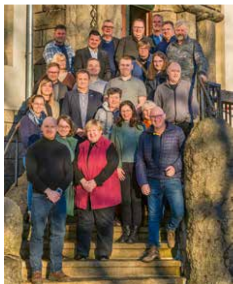
Mitglieder der Lokalen Aktionsgruppe Harz

Lokale Aktionsgruppe Harz startet Projektauftrag