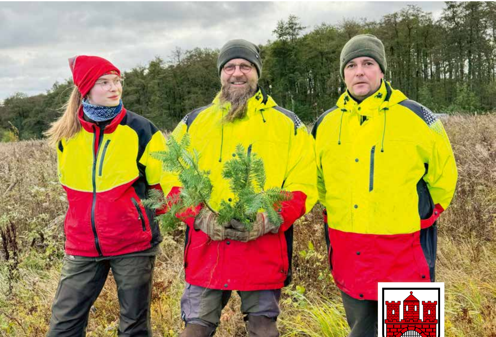
Baumpflanzaktion im Stadtwald Wernigerode am 22.11.2025