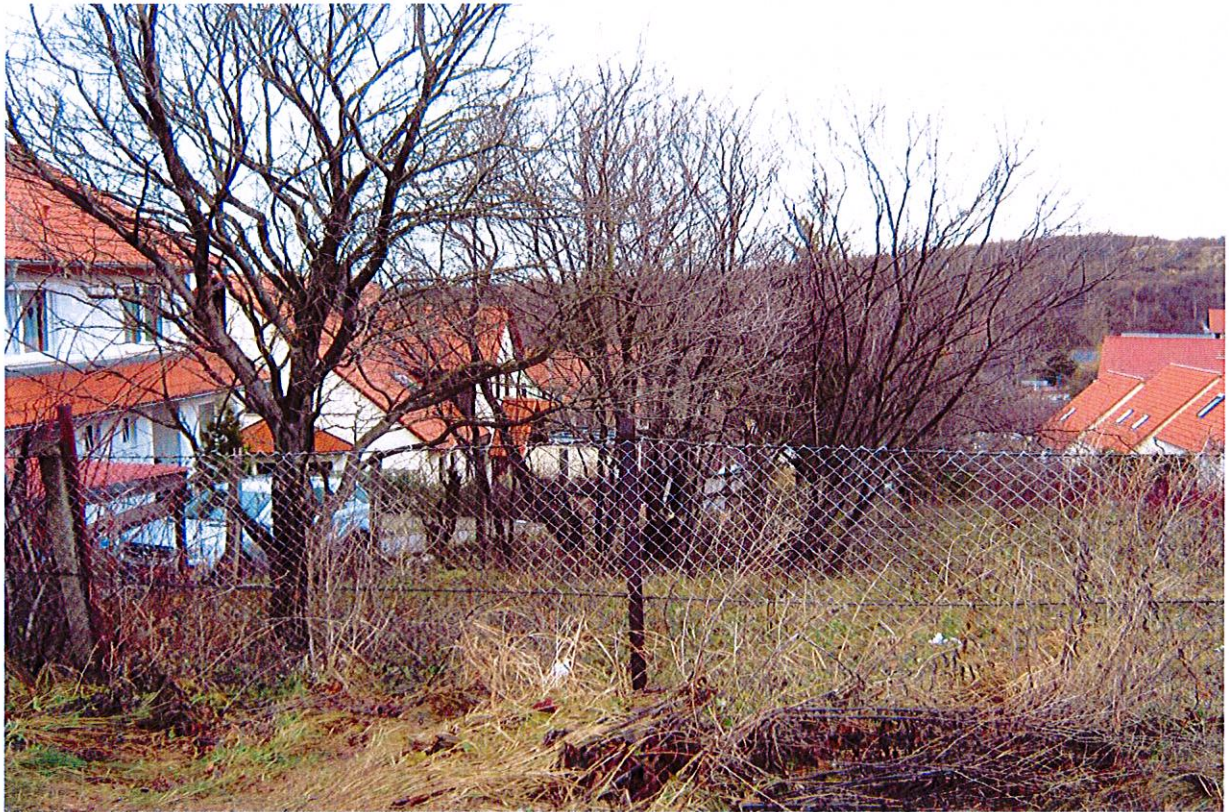
Abbildung 1: Im Bestand erhaltene Pflaumenbäume am Westrand des Gebietes