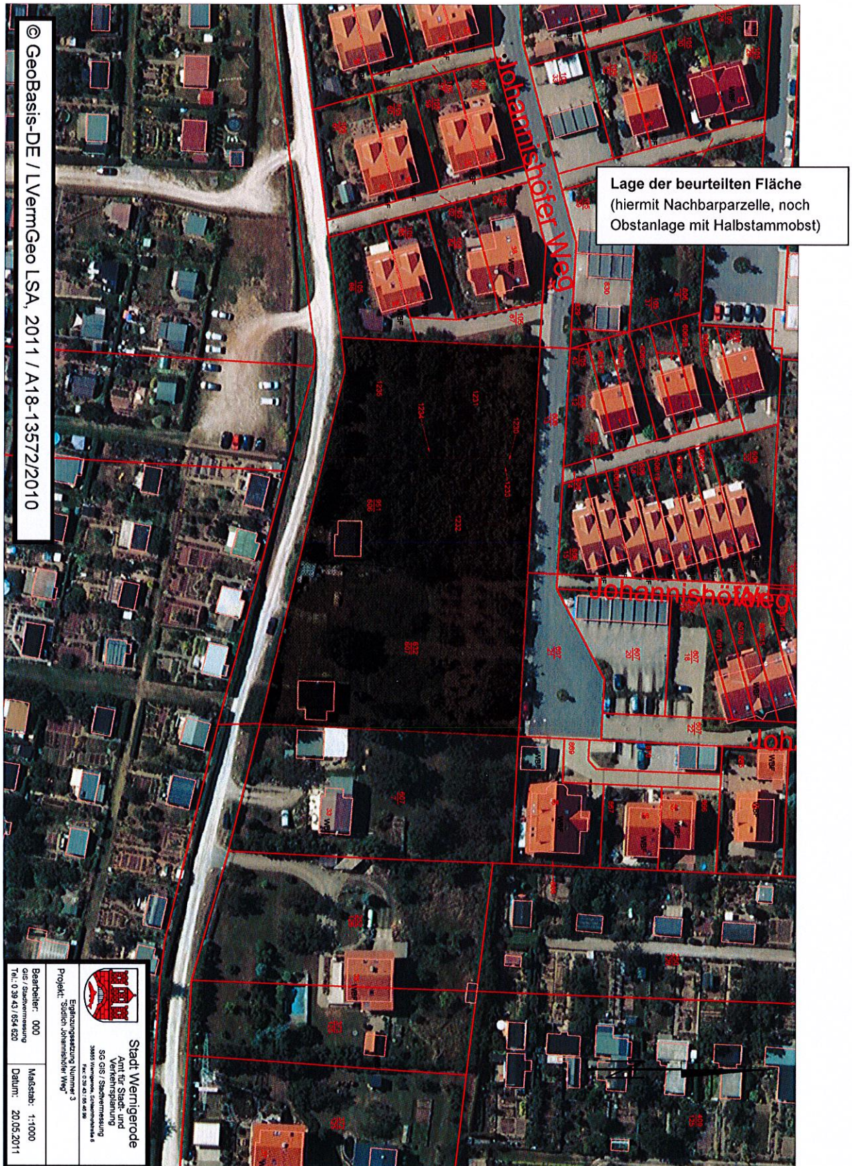
Anhang 2: Luftbild - hier mit einbezogenem Nachbargrundstück (Stadt Wernigerode) Die Schraffur überdeckt ein innerstädtisches Areal von ca. 4.900 m 2 , noch vollständig als Obstanlage erkennbar.