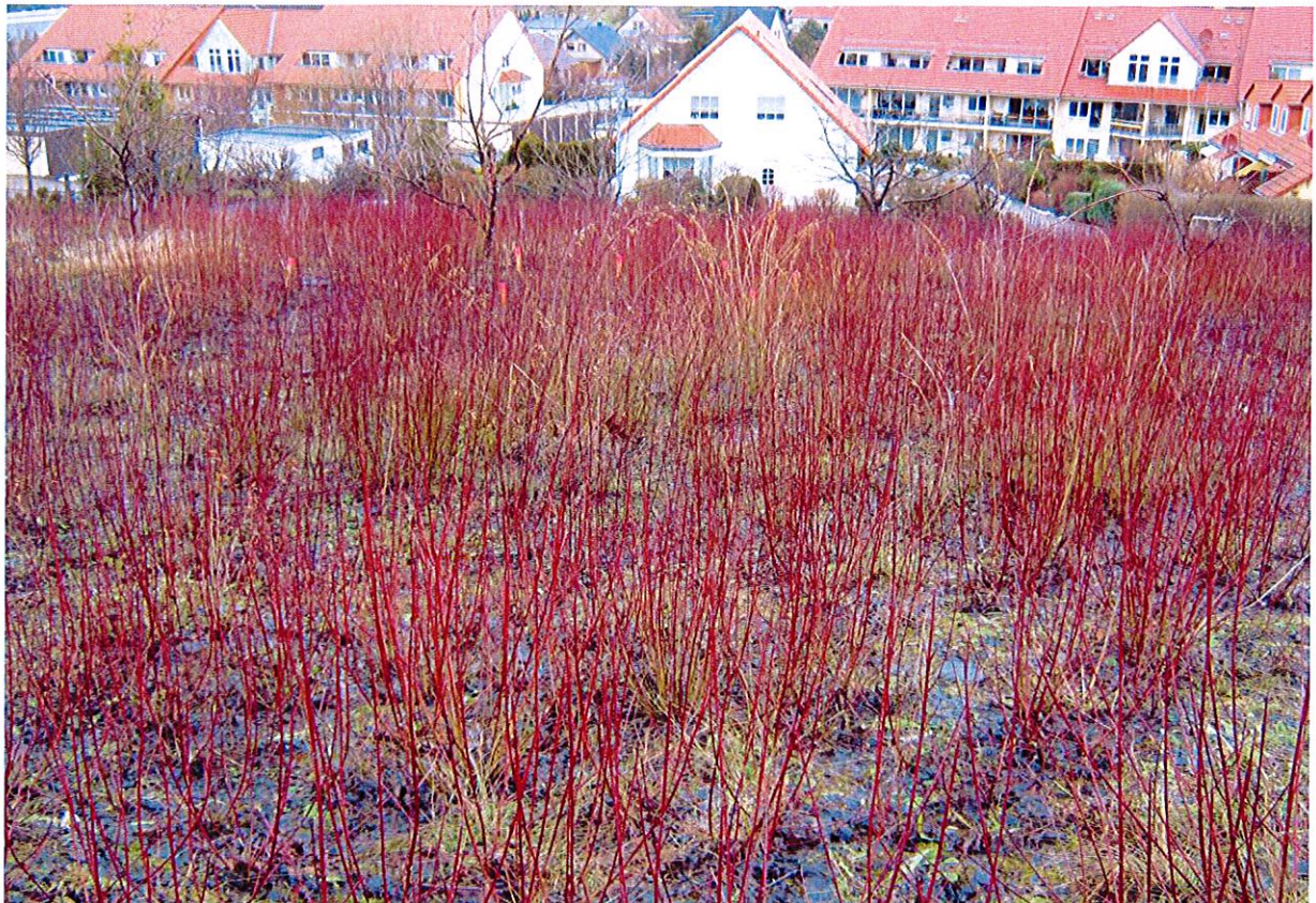
Abbildung 3: Flächige Sukzession von Rotem Hartriegel im Gebiet der früheren Obstanlage