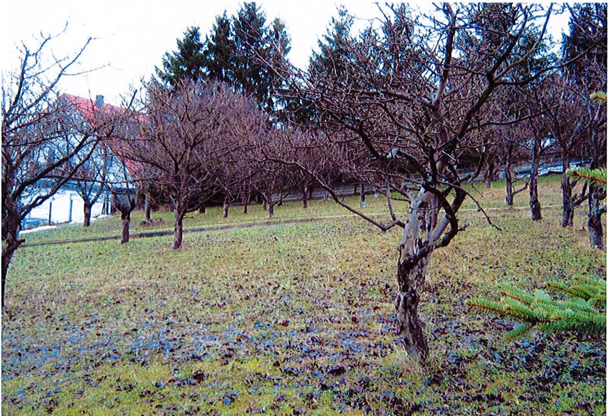
Abbildung 6: Im östlichen Bestand derzeit noch bewirtschaftet: Kirschen- und Apfel-Halbstämme