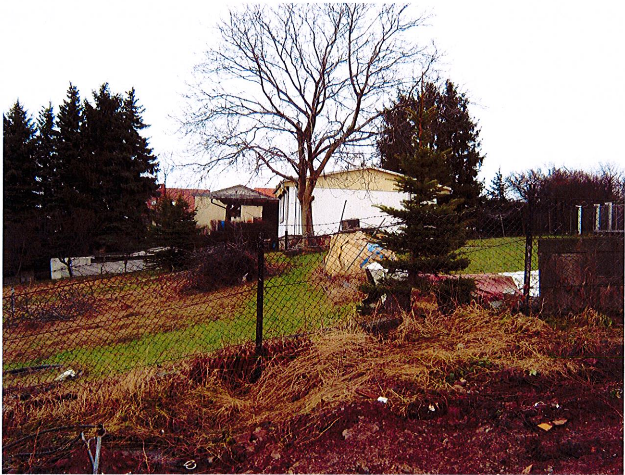
Abbildung 5: Die Obstanlage im Ostteil des Gebietes (hier mit Walnuss und Gärtnerhaus)