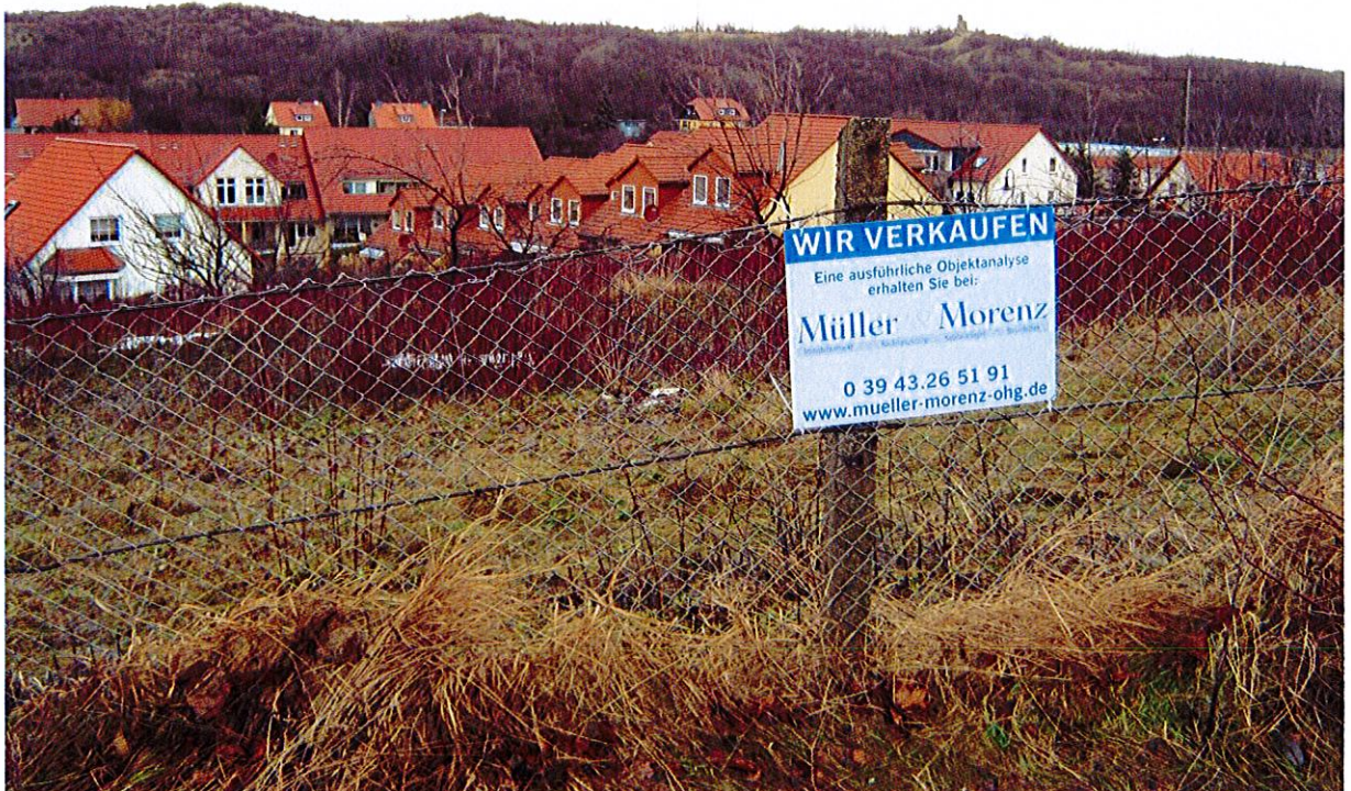
Abbildung 2: Der Südrand des Gebietes mit Einzäunung