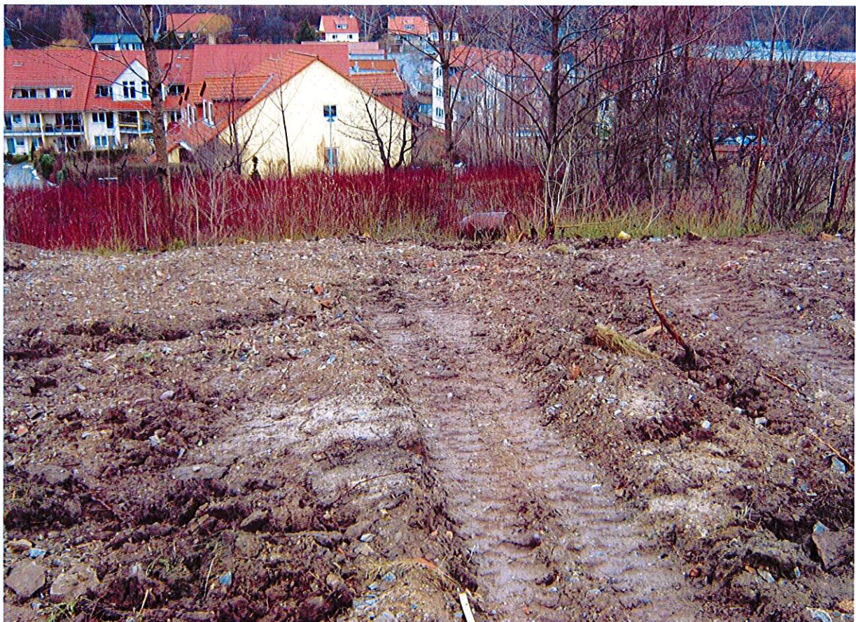
Abbildung 4: Abbruchstelle des Altgebäudes