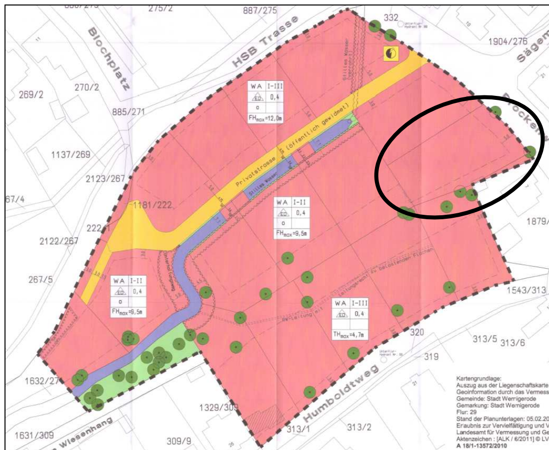
Abb. 1: Geltungsbereich Ursprungsbebauungsplan (unmaßstäblich) mit Markierung des Änderungsbereiches

Der Geltungsbereich der vorliegenden 2. Änderung entspricht einem Teilbereich des Ursprungsbebauungsplanes Nr. 42 „Wohngebiet Humboldtweg/Brockenweg“. Es handelt sich dabei um das Flurstück 377 der Flur 29, Gemarkung Wernigerode mit einer Fläche von ca. 785 m 2 im Osten des ursprünglichen Geltungsbereiches (vgl. Abb. 1 und 2).