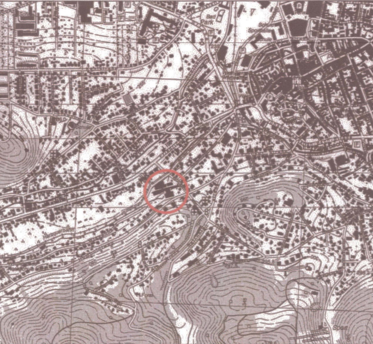
Lage des Geltungsbereiches

Landkreis Harz Stadt Wernigerode 1. Änderung Bebauungsplan Nr. 42 Wohngebiet „Humboldtweg/Brockenweg“