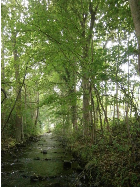
Abbildung 1: Blick in den Auwald-Bestand am Zillierbach – Stand 30.06.2017.