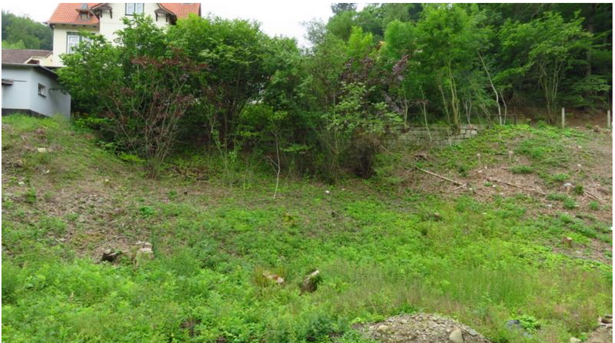
Abbildung 4: Von Haselnussbüschen verdeckte Bruchsteinmauer – Stand 30.06.2017.

Die an der Plangebietsgrenze verlaufende Bruchsteinmauer stellt eine wertvolle Struktur dar. Der Erhalt dieser Struktur ist zu empfehlen