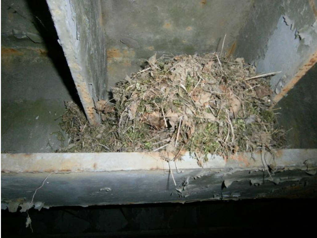
Abbildung 11: Nest einer Wasseramsel unter der Brücke nordwestlich des Plangebietes – Stand 30.06.2017