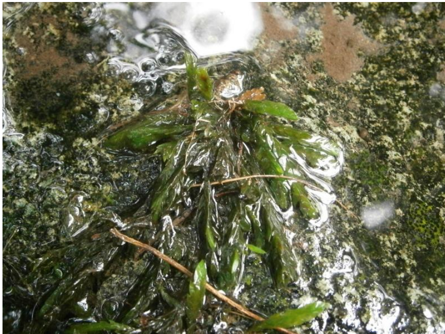
Abbildung 2: Fontinalis antipyretica – FFH-Art im Zillierbach – Stand 30.06.2017