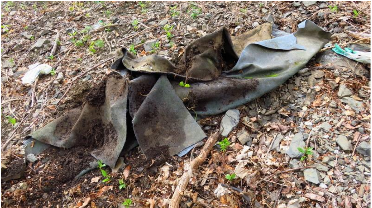
Abbildung 8: Versteck von zwei adulten Feuersalamandern – Stand 30.06.2017.