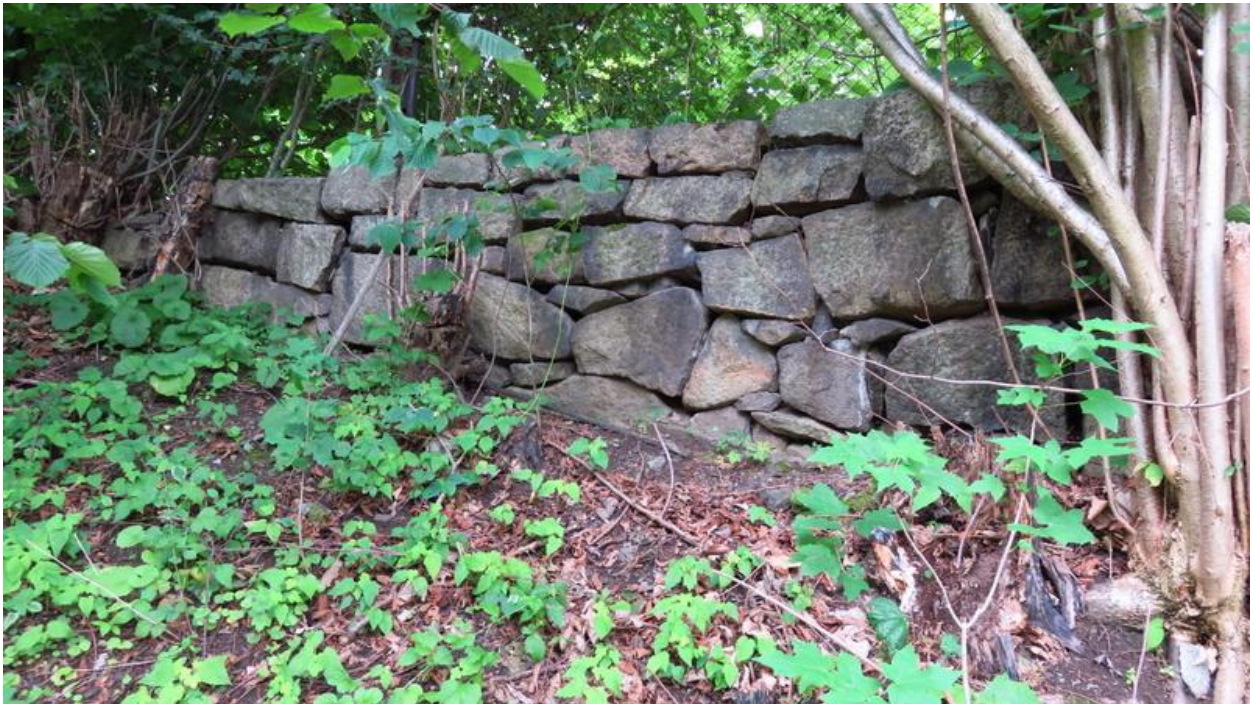
Abbildung 5: Bruchsteinmauer in Nabsicht – Stand 30.06.2017.

Die Bruchsteinmauer bietet bis zu 40 cm tiefen Spalten, welche für Amphibien und Kleinsäuger wertvolle Habitate darstellen.