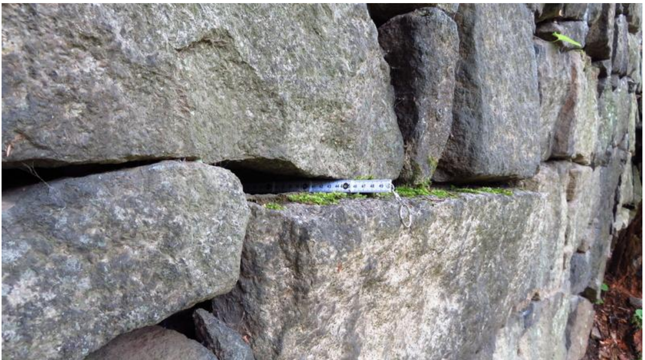
Abbildung 6: Tiefe Spalten in der Bruchsteinwand – Stand 30.06.2017.

Die Bruchsteinmauer bietet bis zu 40 cm tiefen Spalten, welche für Amphibien und Kleinsäuger wertvolle Habitate darstellen.