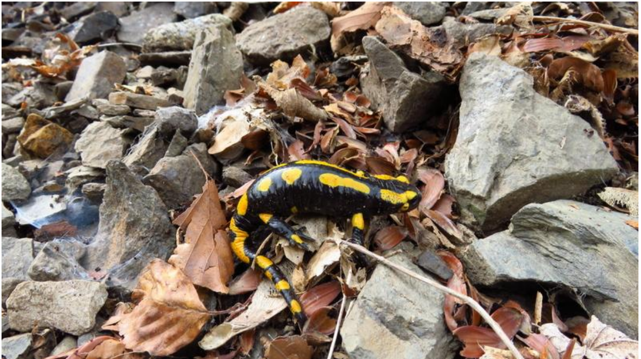
Abbildung 7: Feuersalamander ( Salamandra atra ) auf dem Plangebiet – Stand 30.06.2017.