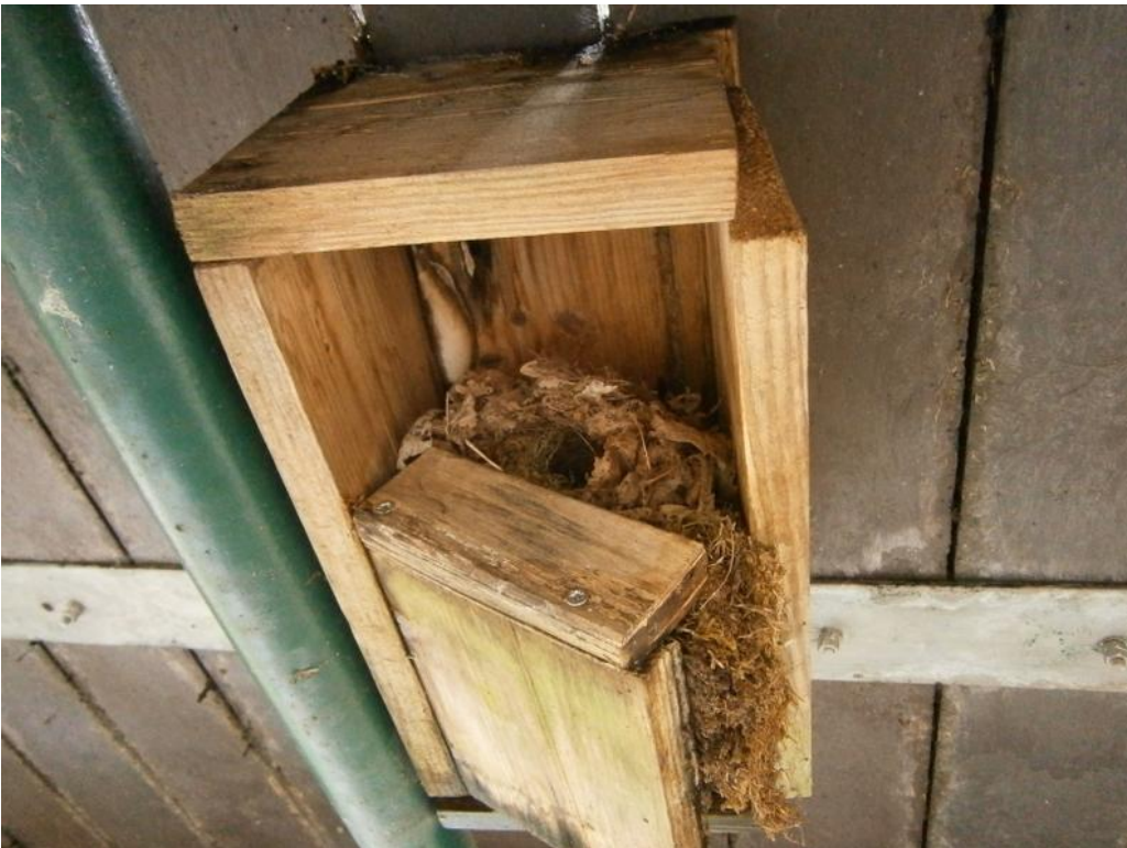
Abbildung 10: Nistkasten mit Nest einer Wasseramsel unter der Brücke nordöstlich des Plangebietes – Stand 30.06.2017