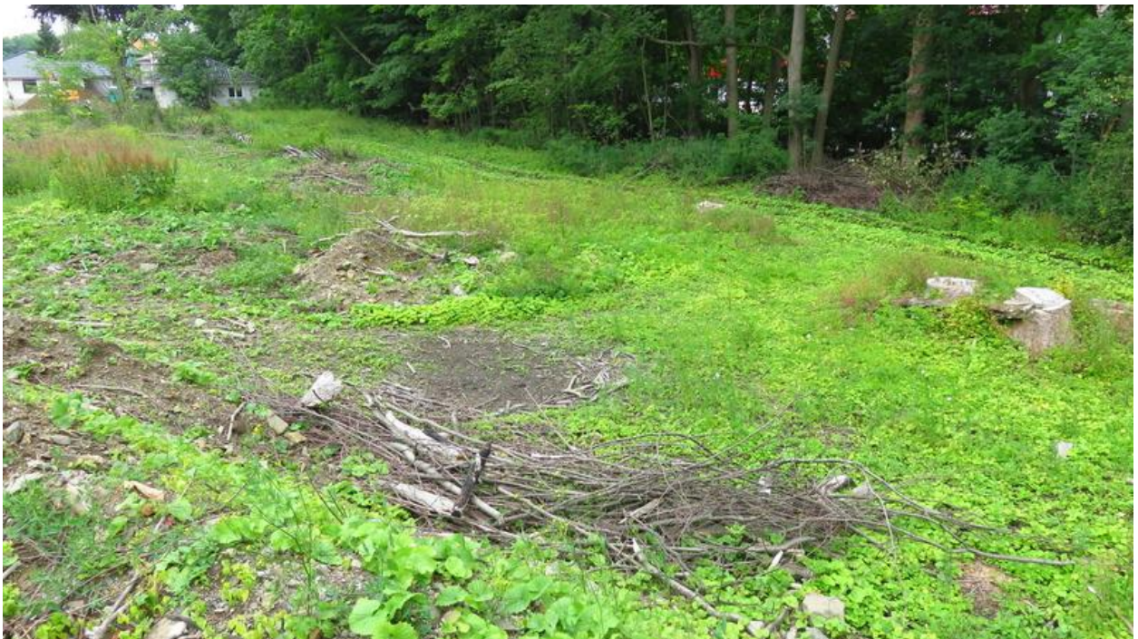
Abbildung 3: Teil des Plangebietes mit Reisighaufen (pot. Amphibienversteck) – Stand 30.06.2017.