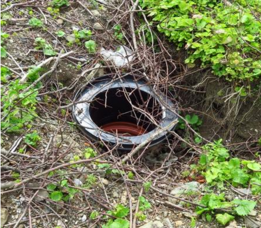
Abbildung 9: Ökologische Falle für Amphibien und Kleinsäuger durch offenen Schacht – Stand 30.06.2017