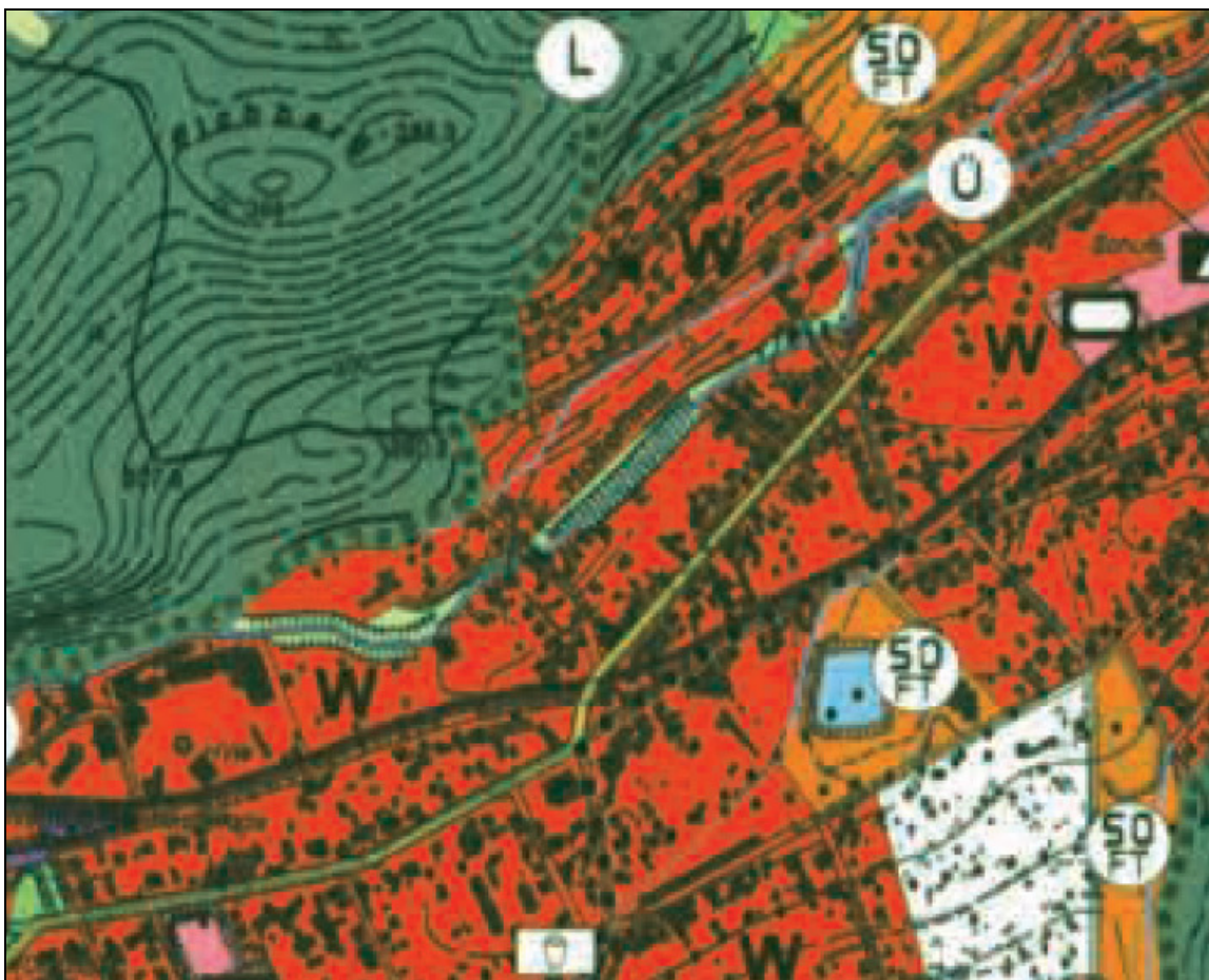
Abbildung 3: Ausschnitt aus dem Flächennutzungsplan [TK10 / 6/2012] © LVermeGeo LSA ( www.lvermegeo.sachsen-anhalt.de ) / A18/1-13572/2010