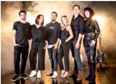
»Noch ist Zeit«

Zusätzlich wird die in Staßfurt gegründete Band »Noch ist Zeit« auftreten, der MDR SACHSEN-ANHALT einen großen Auftritt ermöglicht. Die Band begeistert seit über zehn Jahren mit einer Mi-