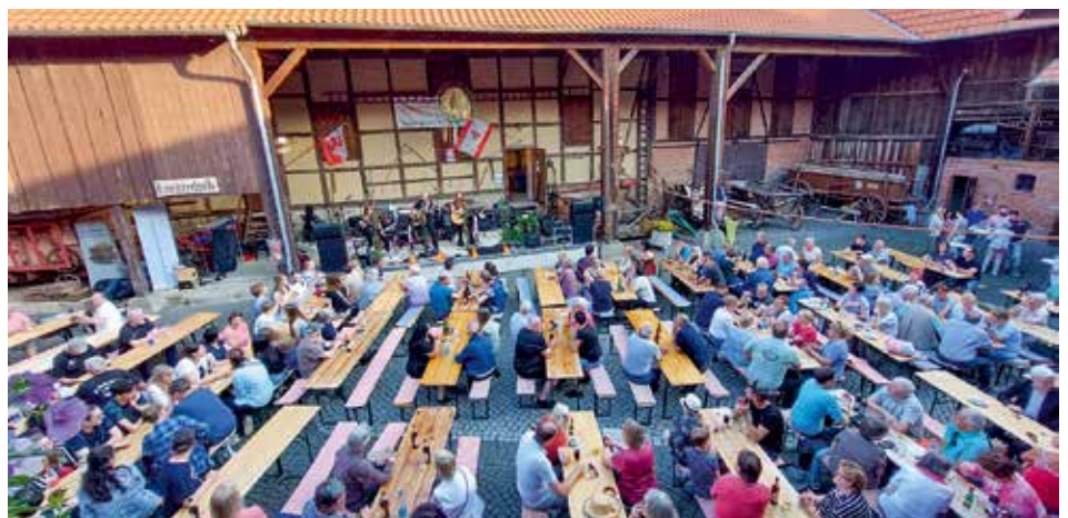
»PS Beat« beim Oppn Hoff 2023, vor dem vollen Silstedter Museumshof

Für das leibliche Wohl mit Speis und Trank sorgen die Mitglieder des Fördervereins Museumshof ERNST KOCH in Silstedt. Für kurzfristige Programmänderungen wird um Verständnis gebeten. //