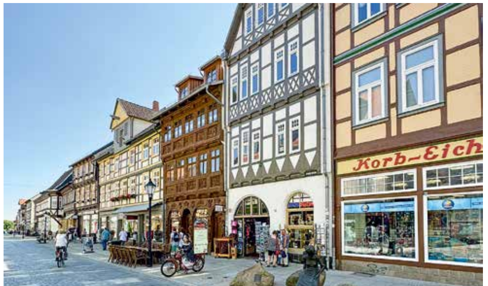
Wernigerodes Fachwerk-Juwelen in Breiter Straße 70 und 72 in GWW-Sanierung und danach frisch renoviert