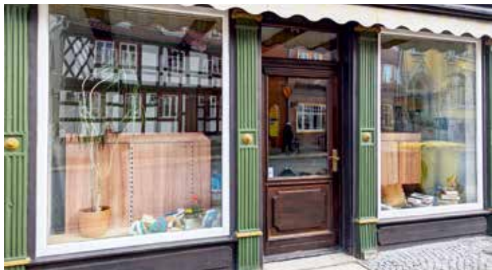
Frauenzentrum in der Marktstraße 11

Eine Anmeldung ist erforderlich. Diese ist möglich direkt im Frauenzentrum, Marktstr. 11, oder telefonisch unter 03943-626012 bzw. per Mail unter FrauenzentrumWR@web.de //