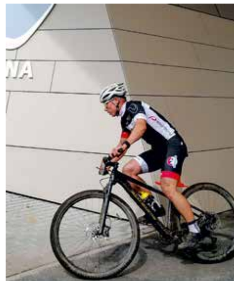
Endurothon: © Josephine Hedderich

Egal ob Veranstaltung oder das tagtägliche Angebot wie Minigolfen, Rollschuhlaufen, Inlinern, Bouldern, Trampolinspringen, Tischtennis, Tischkicker, XXL-Spiele spielen oder Hüpfparcours – es ist ein Erlebnis für die ganze Familie, die Arena zu besuchen.