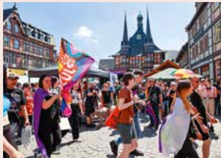
Eröffnung des zweiten Christopher Street Days in Wernigerode am 8. Juni – Wernigerode, die Bunte Stadt am Harz!