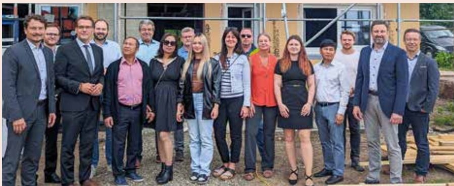
Richtfest im Wohngebiet »Kastanienwäldchen« – hier entstehen Reiheneinfamilienhäuser.