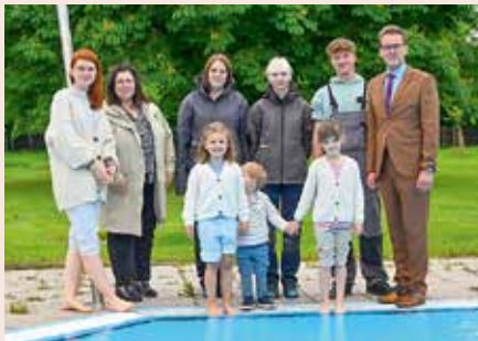
Das Waldhofbad ist in die Saison gestartet. Wir freuen uns auf einen tollen Sommer und viele Gäste!