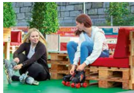
Auf der 1500 qm großen Kunststofffläche lässt sich wunderbar Rollschuhlaufen oder Inlinern. Rollschuhe stehen zur Ausleihe bereit.