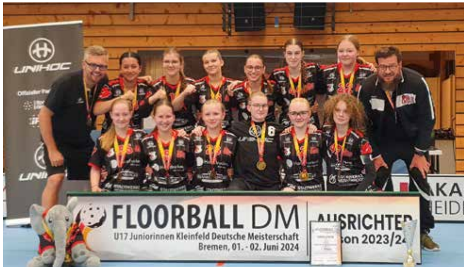
Die U17 Juniorinnen der Red Devils vom Wernigeröder SV Rot-Weiß haben eine erfolgreiche Saison 2023/2024 mit dem Deutschen Meistertitel gekrönt.