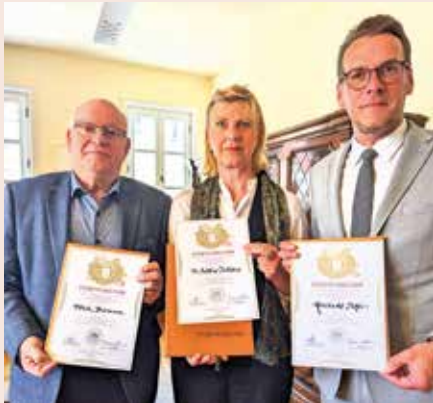
Zur letzten Sitzung des amtierenden Stadtrates am 20. Juni gab es besondere Urkunden für langjähriges Engagement einiger Stadträtinnen und Stadträte.