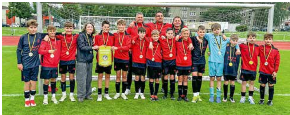
Ungeschlagene Sieger der Landesliga Staffel 2 D-Junioren U13: die JSG Wernigerode bestehend aus Spielern beider Vereine: Germania und FC Einheit. Herzlichen Glückwunsch!

Im Nu strahlte der Schulhof wieder, und als Dank gab es eine Grillwurst zur Stärkung. Vielen Dank von den Hortkindern, die den Schulhof gleich mit ihren Fahrzeugen in Besitz nahmen! // Team Hort Harzblick