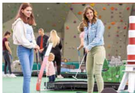
Minigolf an zehn Stationen. Schläger und Bälle stehen zur Verfügung.