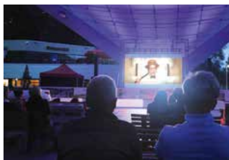
Sommerkino in der Arena.