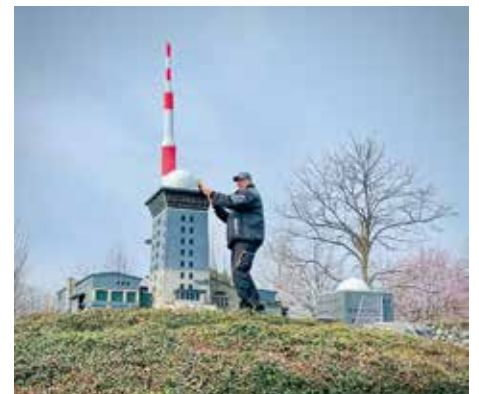
Der Brocken wird geputzt

Zum Modellbaufest gelten Sonder Eintrittspreise: Erwachsene zahlen 7 € Eintritt und Kinder 4 €. An diesem Tag gelten keine Saisonkarten. //