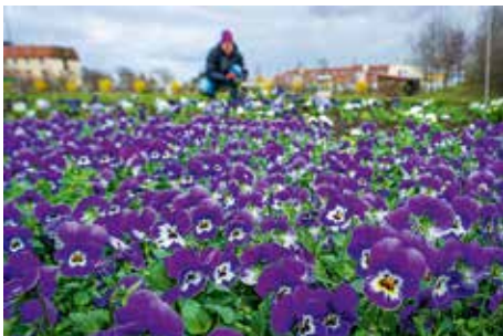
Ein Meer aus lila Farbtönen wird in die Beete im Bürgerpark gepflanzt

Seit dem 06. April ist der Bürger- und Miniaturenpark wieder in die neue Saison gestartet. Modell-Sehenswürdigkeiten bestaunen, spazieren, picknicken, entspannen – all das ist inmitten der erwachenden Miniatur- und Gartenwelt wieder möglich. Mit der neuen Erlebnisturmanlage ist auch in diesem Jahr für Action gesorgt: drei Türme,