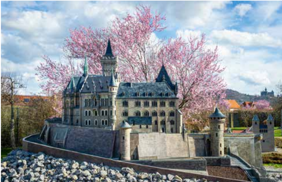
Ein Hingucker im Frühling: Das Schloss mit Blutpflaume im Hintergrund

Seit dem 06. April ist der Bürger- und Miniaturenpark wieder in die neue Saison gestartet. Modell-Sehenswürdigkeiten bestaunen, spazieren, picknicken, entspannen – all das ist inmitten der erwachenden Miniatur- und Gartenwelt wieder möglich. Mit der neuen Erlebnisturmanlage ist auch in diesem Jahr für Action gesorgt: drei Türme,