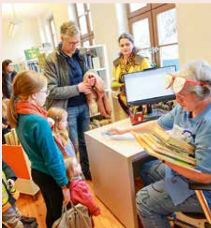
Eröffnung der neuen Kinderbibliothek im Gebäude des Harzmuseums.