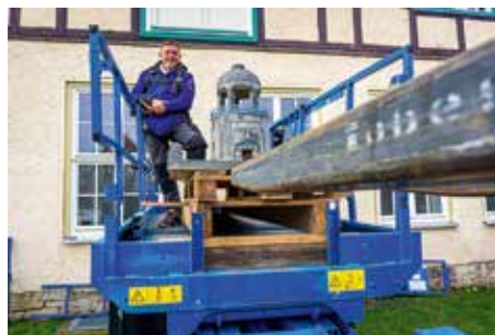
Per Hebebühne werden die Modelle aus dem Winterquartier geholt

Mehr als 30 Veranstaltungen hat das Parkteam für 2024 zusammengestellt. Ein unverzichtbarer Bestandteil des Programms ist das Modellbaufest geworden. Am 1. Mai 2024 bietet es erneut ein ganz besonderes Erlebnis für alle Liebhaber von Miniatur-Fahrzeugen, Bahnen, Fliegern und Booten. Denn von 10:00 bis 17:00 Uhr präsentieren zahlreiche Vereine, Clubs, Privatpersonen und Firmen aus ganz Deutschland stolz ihre Hobbys.