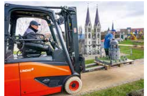
Alle Modelle werden wieder an Ort und Stelle im Kleinen Harz gebracht