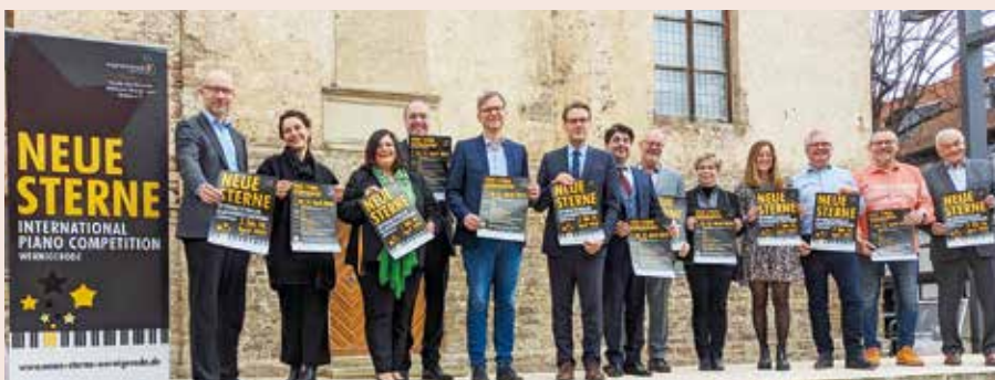
Sponsorempfang für den Klavierwettbewerb NEUE STERNE.