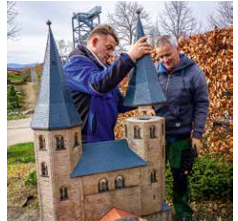
Das Kloster Drübeck erhält seine formgebenden Türme

Höhepunkte des Tages sind unter anderem die actiongeladenen Vorführungen der ferngesteuerten RC-Cars, die mit waghalsigen Manövern über die Wiese im Eingangsbereich rasen. Währenddessen navigieren Mini-Trucker ihre LKW's, Bagger, Radlader, Feuerwehren und andere selbstgebaute Modell-Fahrzeuge durch den gesamten Park. Mutige können sogar einen Miniführerschein machen oder selbst auf der Carrerabahn mit kleinen Flitzern Rennen fahren. Während die Modellboote majestätisch über den Schreiberteich gleiten, zieht im Bürgerwäldchen eine Aufsitz-Dampflokomotive ihre Runden und lädt zum Mitfahren ein. »Die Lok wird