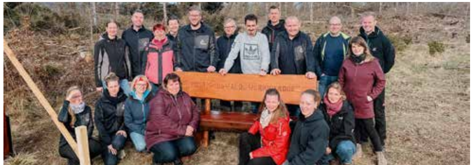
Rastplatz am Tourismuswald