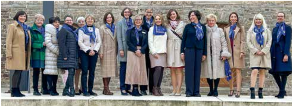
Damen vom Lions Club Anna zu Stolberg Wernigerode

Der Lions Club »Anna zu Stolberg Wernigerode« bedankt sich bei allen Beteiligten für ihre Unterstützung und freut sich darauf, auch weiterhin einen wichtigen Beitrag für die lokale Gemeinschaft leisten zu können. //