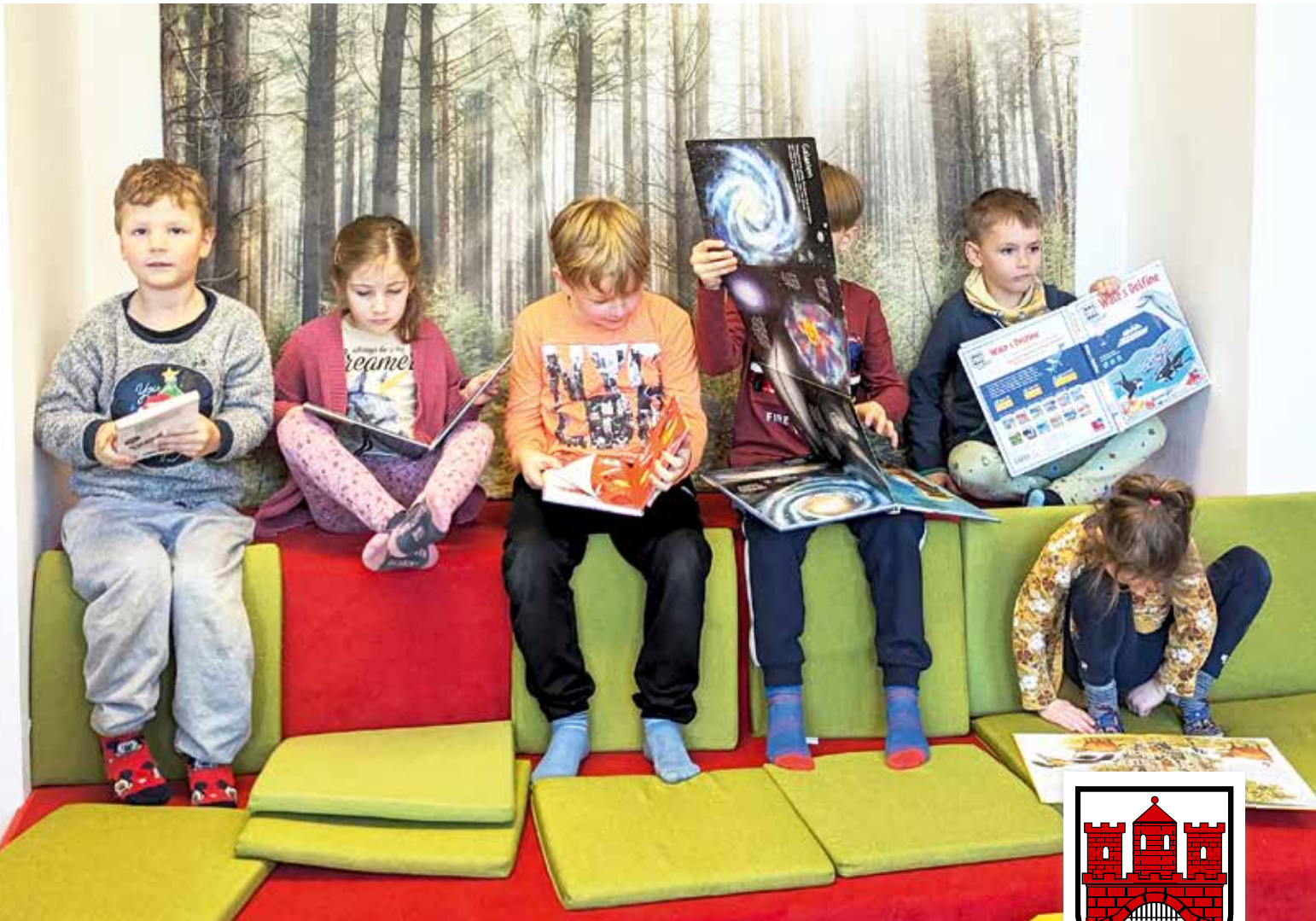
Kinder der KITA »Quasselstippe« in der neuen Kinderbibliothek