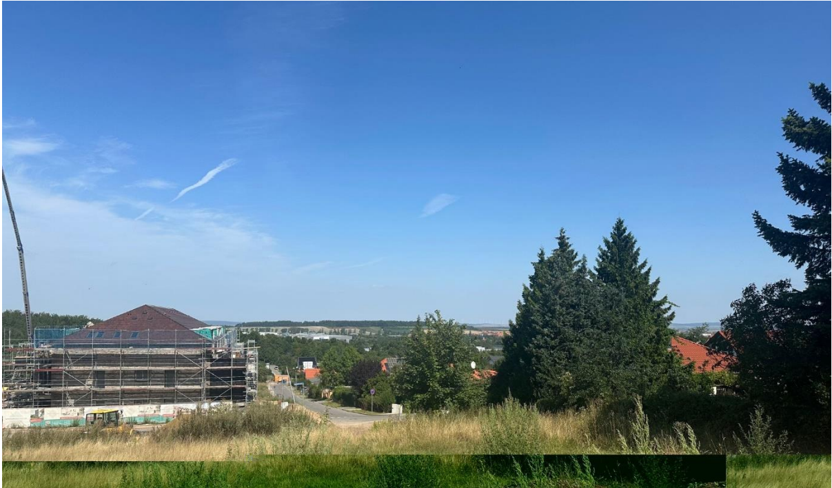
Blick Richtung Norden ins Nördliche Harzvorland