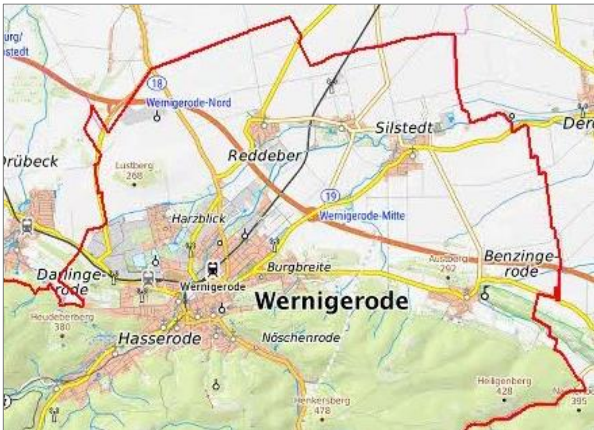
Abbildung 1 - [DTK10/2022]

Zu den größeren, nahegelegenen Städten gehören u. a. Magdeburg (ca. 90 km), Halle (ca. 110 km) und Leipzig (ca. 130 km) in östlicher Richtung sowie Braunschweig (ca. 60 km) und Hannover (ca. 120 km) in nördlicher Richtung.