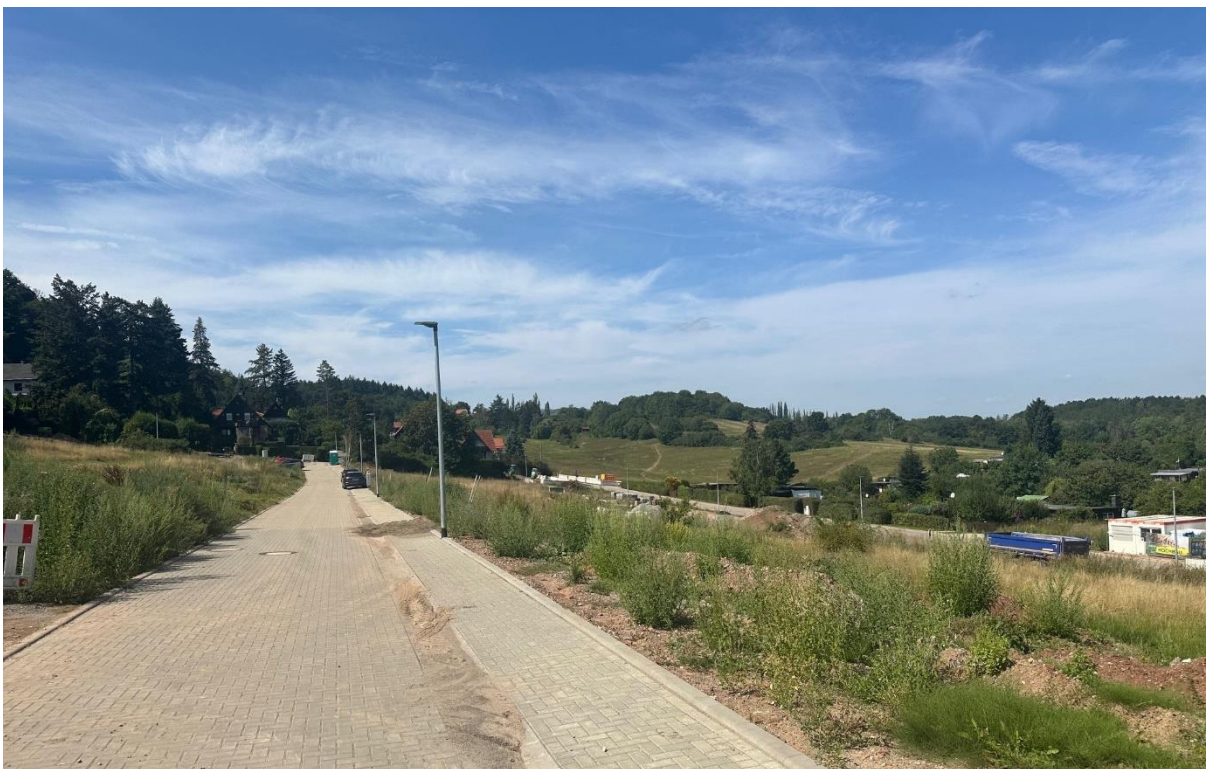
Blick Richtung Westen, auf den Ziegenberg