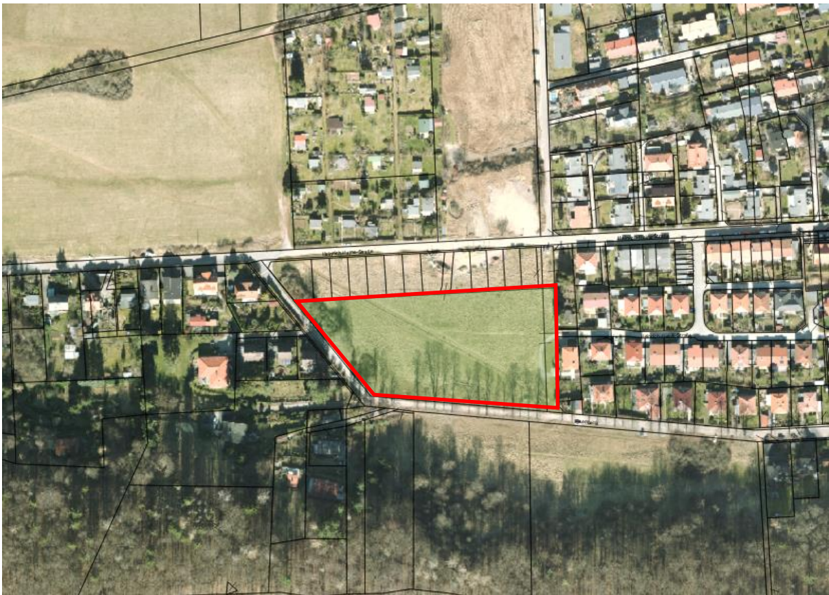
Luftbild, Lage der Parzellen