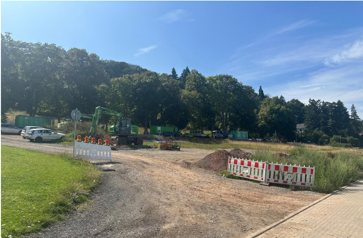
Blick Richtung Westen, auf den Berg „Kakemieke“