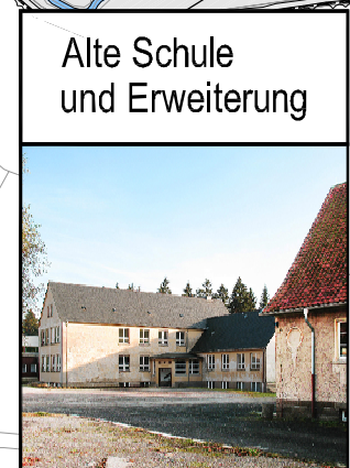
Alte Schule und Erweiterung