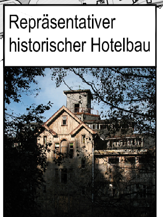
Repräsentativer historischer Hotelbau