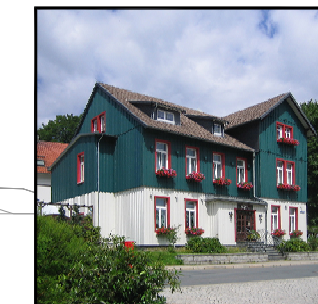
Charakteristische regionale Bauweise