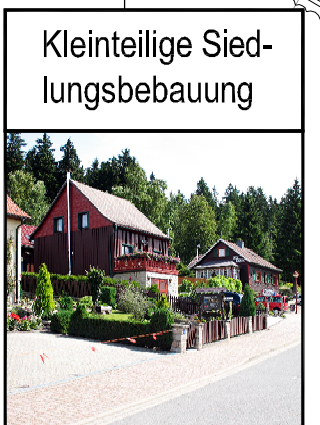
Kleinteilige Sied- lungsbebauung