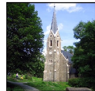
Bergkirche und Friedhof