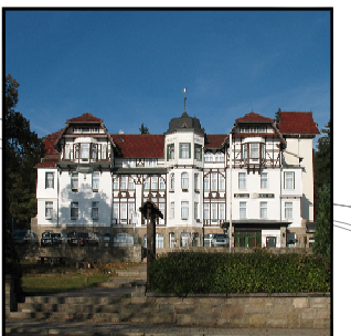
Repräsentativer historischer Hotelbau