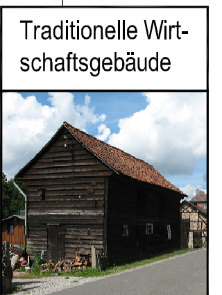
Traditionelle Wirt- schaftsgebäude