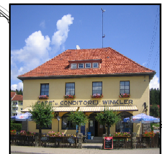
Architektur um 1920