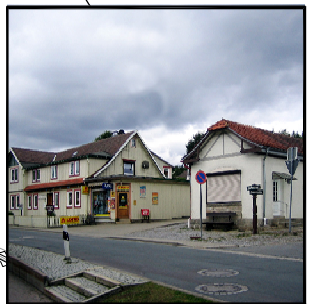
Straßenbegleitende kleinteilige Bebauung