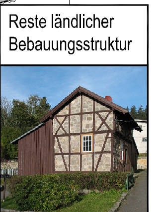
Reste ländlicher Bebauungsstruktur