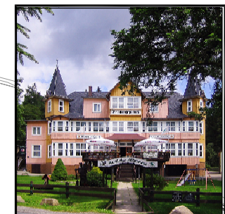
Repräsentativer historischer Hotelbau