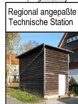
Regional angepaßte Technische Station