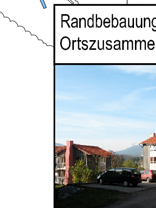
Randbebauung ohne Ortszusammenhang